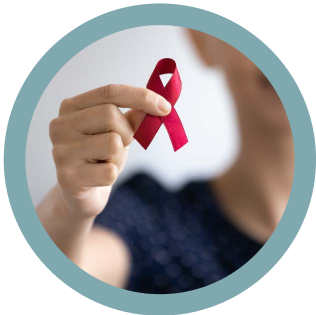
Arbejde for lige rettigheder