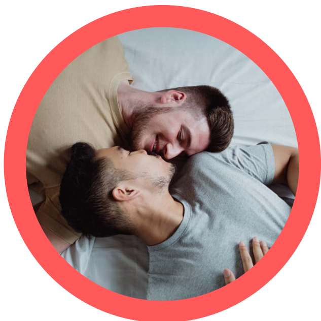
Test og rådgivning